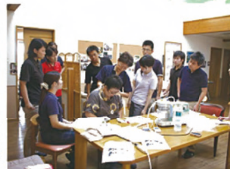
看護師との連携により介護技術を研さん