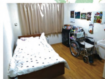
お一人の時間も大切にできます