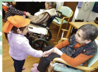
保育園児(ぼっ歩保育園)との交流