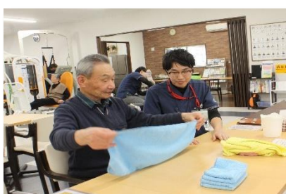
日常生活動作訓練