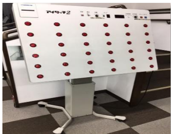
ビジョントレーニング