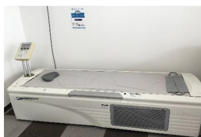
リラクゼーション