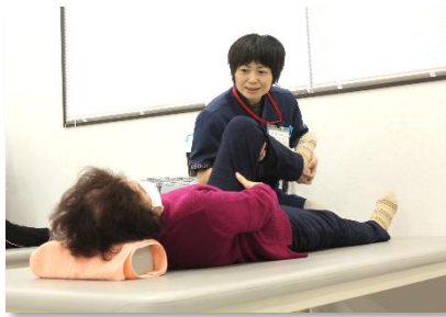
個別アセスメント